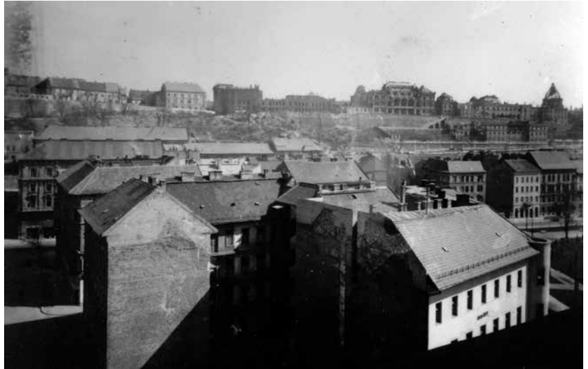
Krisztinaváros látképe a templomtoronyból, balra a Roham utca, jobbra a Horváth-kert egy részlete, háttérben a romos Királyi Palota (ma Budavári Palota), 1946

Az első belövés 1944 karácsony estéjén érte a plébániát. A káplán délután a Sziklakórházban volt, hogy a betegeknek rendezett kis karácsonyi gyertyagyújtáson beszéljen. A budaörsi HÉV-et aznap bombatalálat érte, tömegével érkeztek a sebesültek a kórházba, így ő is beállt az orvosok mellé, az altatásban segédkezett. Háromnegyed hétkor rohant át a templomba, hogy a hét órai misét még elérhesse. A visszaemlékezésből tudjuk, hogy a plébános aznap este sem feledkezett meg az ott szolgálókról, Fundelius is kapott karácsonyi ajándékot: egy doboz cipőkrém.