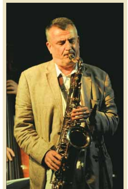
A budavári könyvünnepe a Dresch Quartet nagy sikerű koncertjével zárult.