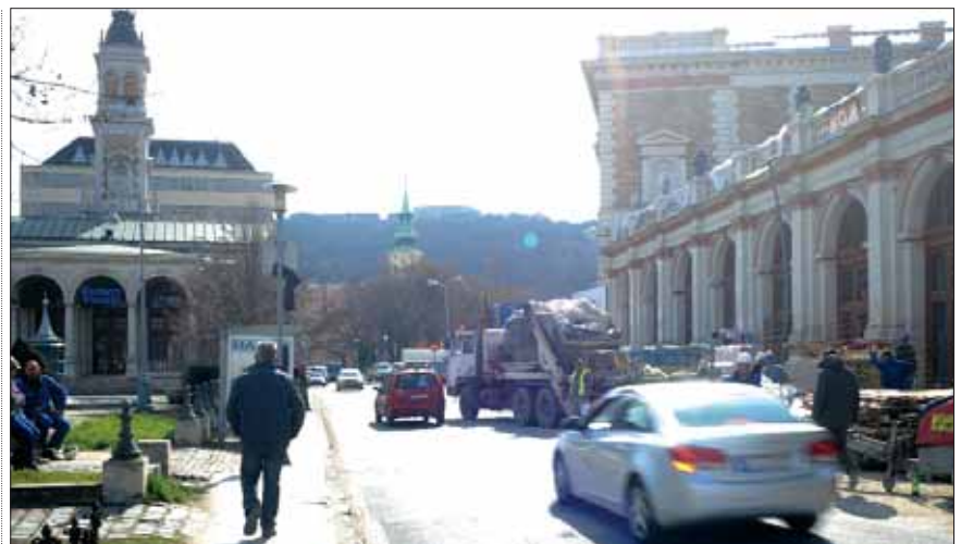
Rövidesen megszépül és kőburkolatot kap az Ybl Miklós tér is

A Gellért rakpart felől érkező autósok a Lánchíd utcát a Szarvas téri új „indirekt” kapcsolaton keresztül közelíthetik majd meg, a turistabuszok részére pedig le- és felszállóhelyet alakítanak ki az Apród utcában. A Lánchíd ut-